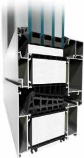
MB-104 Passive Aero