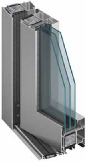
MB-104 Passive SI