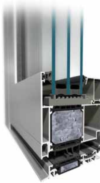
MB-104 Passive SI